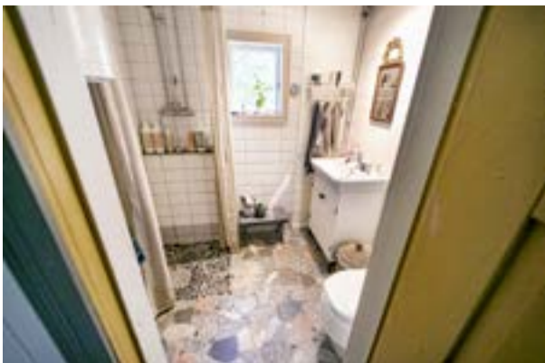
Badrummet i huset. Bitte Håf har konstruerat en dold dörr vid ingången så att öppningen kan vidgas vid behov.