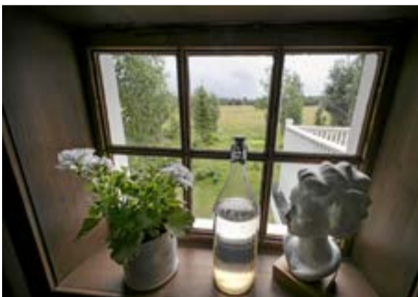
Skogstomten till huset gränsar mot vidsträckt åkermark. Bitte Håf och Matz Malm planerar för ett växthus och har börjat samla på sig fönster och annat att bygg av. Även ett höns hus och bikupor finns med i framtidsplanerna.