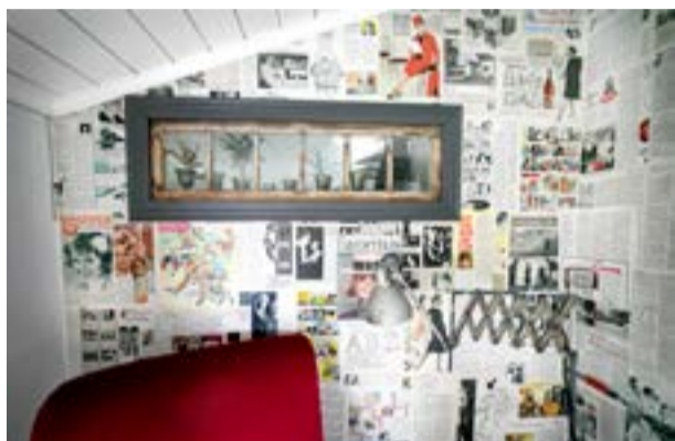
En vägg är klädd med gamla tidningar som hittades under renoveringen.