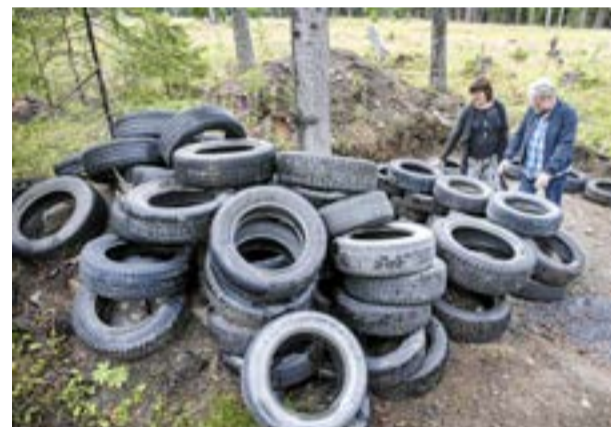
Av bildäcken som de fått är planen att bygga en jordkällare för förvaring av bland annat potatis. Panelen till bygget av pumphus har de fått av en husägare i Odensala som renoverar.