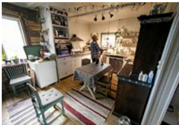
Köket som har en gasspis är samlingsplatsen när det kommer besök. I framtiden hoppas de kunna bygga ut köket för att få rum med fler sittande gäster.