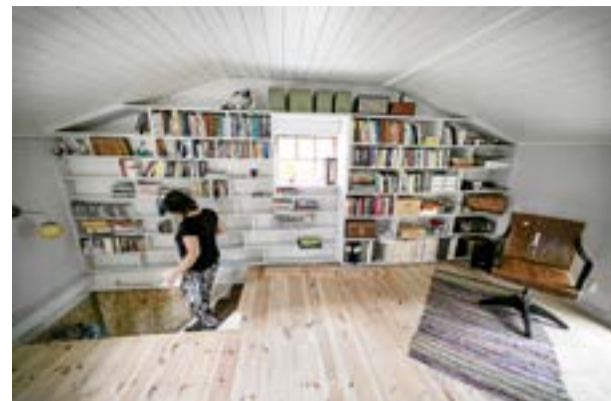
Platsbyggd bokhylla vid trappan på övervåningen. Här och var i huset står detaljer som visar Bitte Håf stora passion.